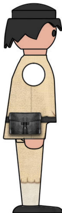
Lado B (vista sin brazo)